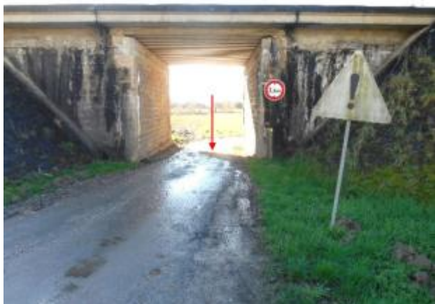
Vue du site et du repère - auteur : Artelia