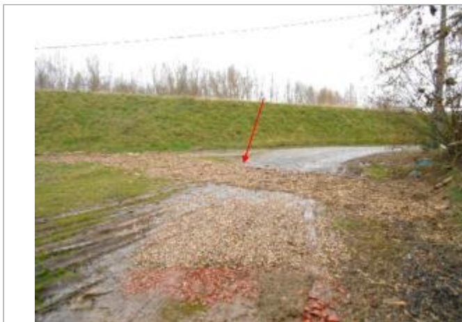
Vue du site et du repère - auteur : Artelia