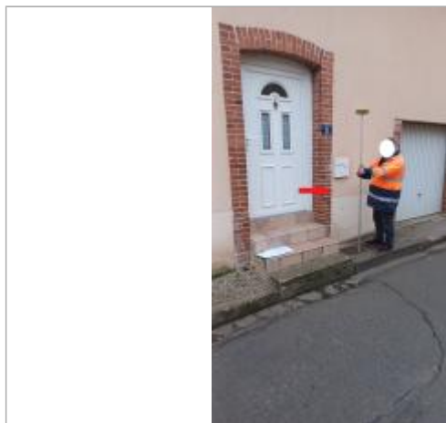
Laisse de crue à 65 cm/sol.

SOURCE DE REPÉRAGE : VISITE DE TERRAIN SPC SACN - 11/03/2020