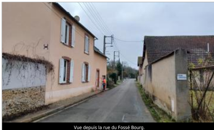
Vue depuis la rue du Fossé Bourg.