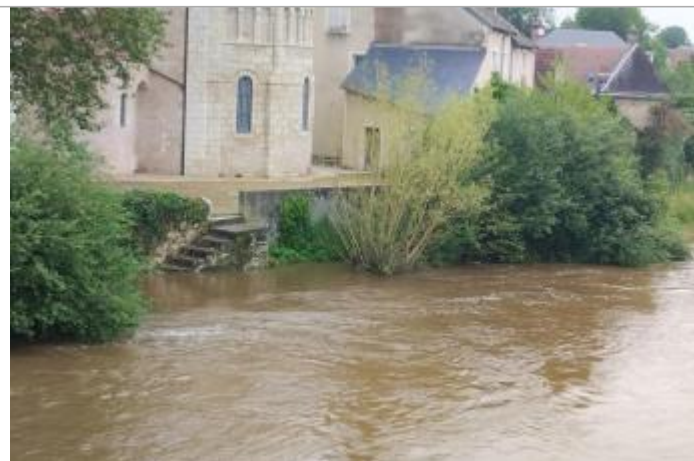
Vue du site lors de la crue de juin 2024