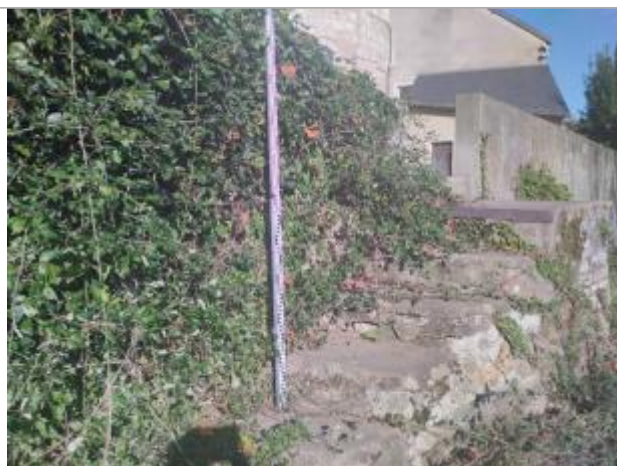
Vue du repère en octobre 2024

Altitude calculée de l'eau (en m) : 157.351 m