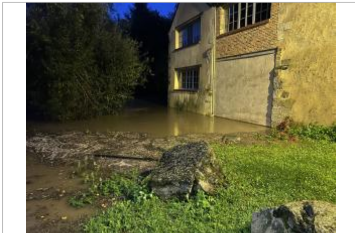
Vue du site lors de la crue