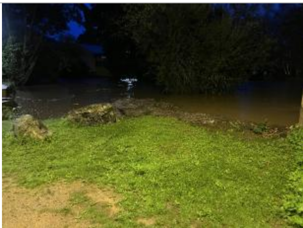
Vue du repère lors de la crue

Altitude calculée de l'eau (en m) : 201.009 m