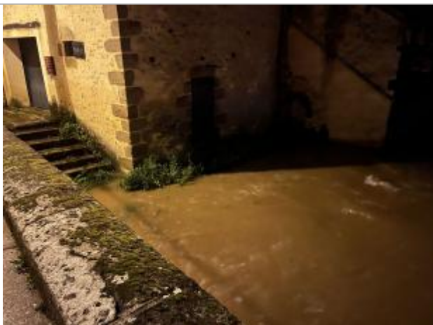
Vue du repère lors de la crue

Altitude calculée de l'eau (en m) : 201.27 m