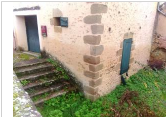
Vue du site en novembre 2025

Coordonnées WGS84 : X: 1.99092200 / Y: 46.58351100