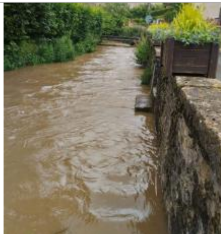
Vue du site lors de la crue