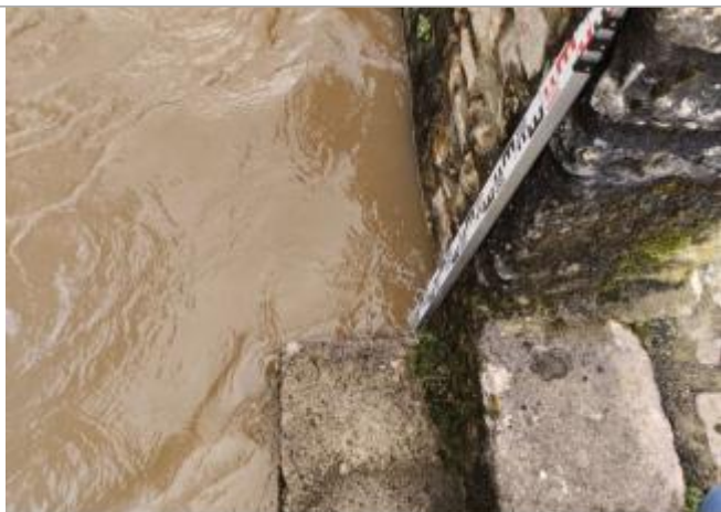
Vue du repère lors de la crue

Altitude calculée de l'eau (en m) : 201.018 m