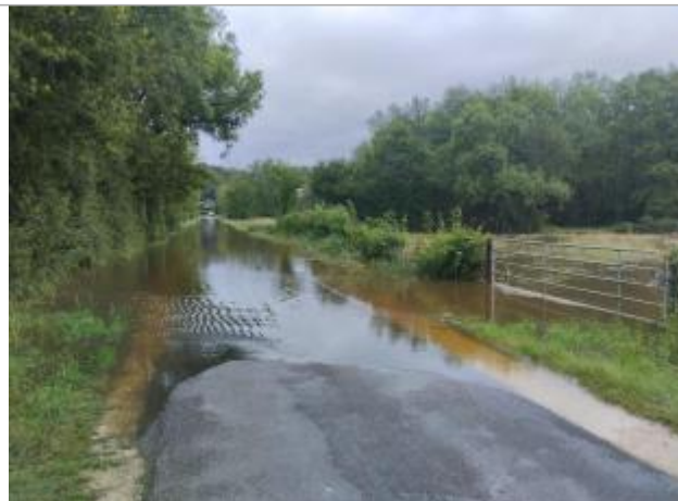
Vue du site lors de la crue