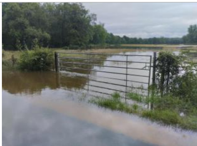
Vue du repère lors de la crue

Altitude calculée de l'eau (en m) : 167.378