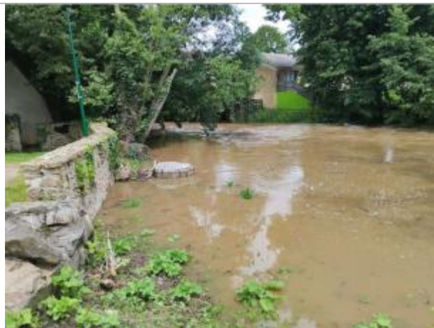
Vue du site lors de la crue