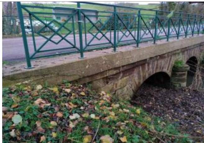
Vue sur le site

Coordonnées WGS84 : X: 1.06898006 / Y: 48.32431810