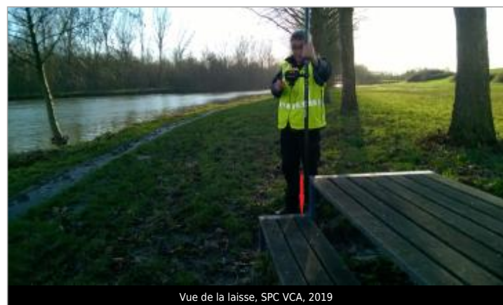
Vue de la laisse, SPC VCA, 2019