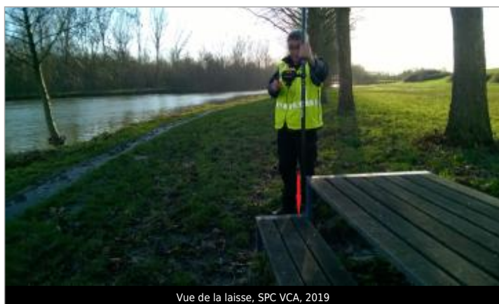
Vue de la laisse, SPC VCA, 2019