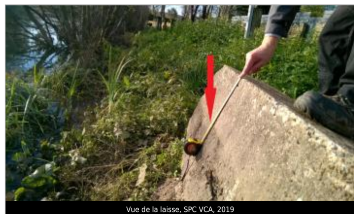
Vue de la laisse, SPC VCA, 2019

GÉNÉRAL Code : 26VCASN19_R_15_1 Date de mise à jour : 13/01/2026 Auteur : SPC VCA