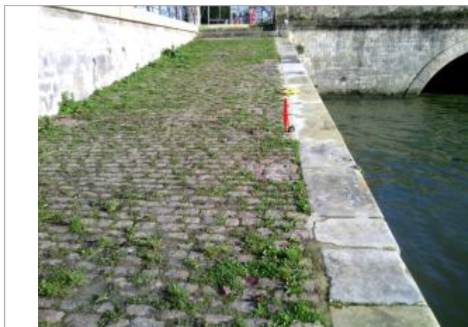
Vue de la laisse, SPC VCA, 2019

SOURCE DE REPÉRAGE : RELEVÉS DE LAISSES DANS LA COMMUNE DE NIORT (79) SUITE À LA CRUE DU 16-12-2019 - 18/12/2019