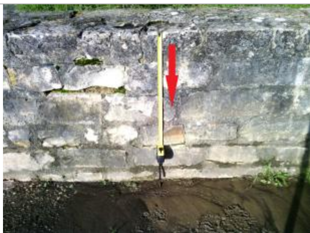
Vue de la laisse, SPC VCA, 2019

Altitude calculée de l'eau (en m) : 12.726 m