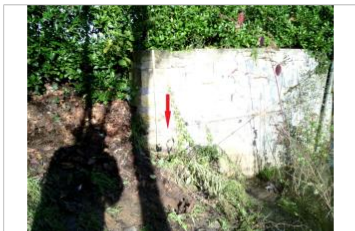
Vue de la laisse, SPC VCA, 2019

Altitude calculée de l'eau (en m) : 13.111 m