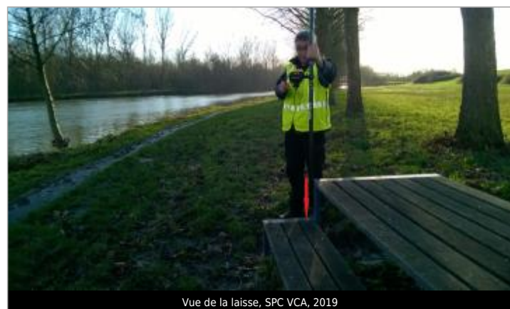
Vue de la laisse, SPC VCA, 2019