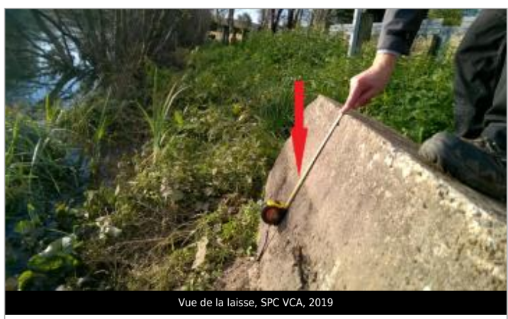
Vue de la laisse, SPC VCA, 2019

GÉNÉRAL Code : 26VCASN19_R_15_1 Date de mise à jour : 13/01/2026 Auteur : SPC VCA