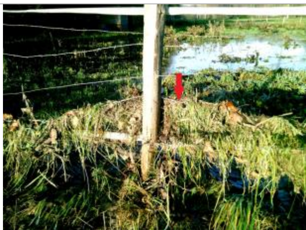
Vue de la laisse, SPC VCA, 2019

Altitude calculée de l'eau (en m) : 15.074