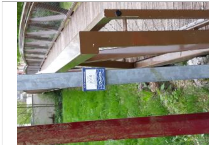
Repère de crue reconstitué Ile du Canada