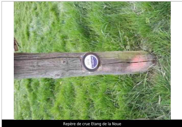
Repère de crue Etang de la Noue

Texte : 31 mai 2016 plus hautes eaux connues - L'Ouanne Maximum de l'inondation : Oui Visibilité : Oui