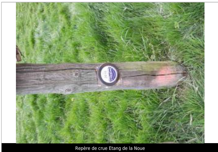
Repère de crue Etang de la Noue

Texte : 31 mai 2016 plus hautes eaux connues - L'Ouanne Maximum de l'inondation : Oui Visibilité : Oui