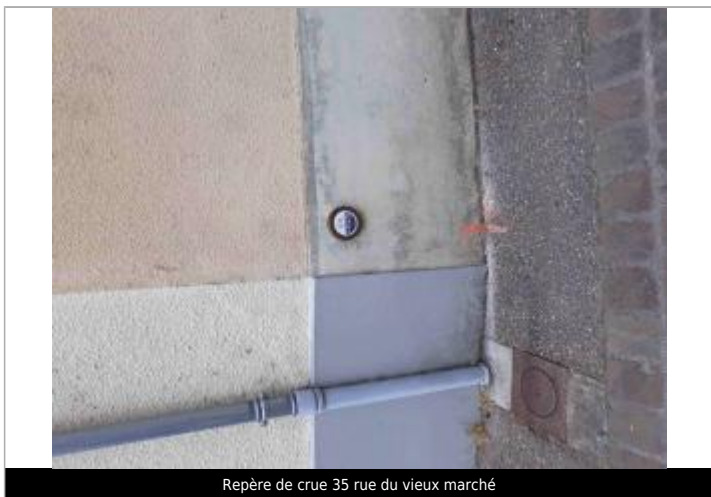
Repère de crue 35 rue du vieux marché

Texte : 31 mai 2016 plus hautes eaux connues - L'Ouanne Maximum de l'inondation : Oui Visibilité : Oui