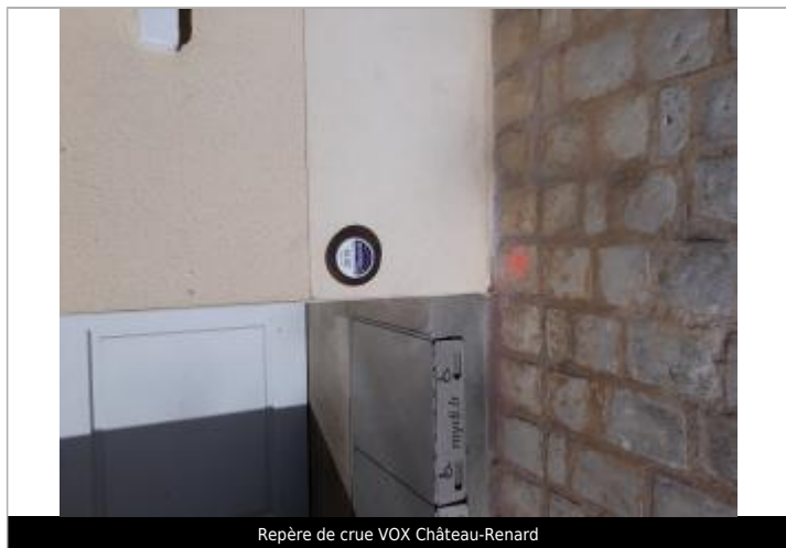
Repère de crue VOX Château-Renard

Texte : 31 mai 2016 plus hautes eaux connues - L'Ouanne Maximum de l'inondation : Oui Visibilité : Oui