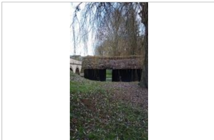
Vue sur le site

Coordonnées WGS84 : X: 1.15266440 / Y: 48.28342770