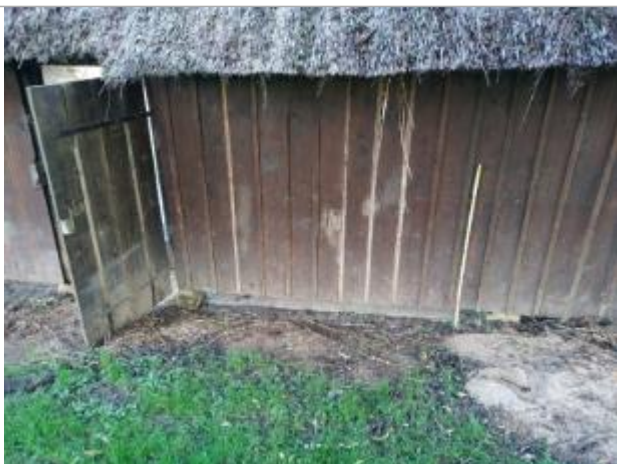
Vue sur la laisse d'inondation

Altitude calculée de l'eau (en m) : 174.47