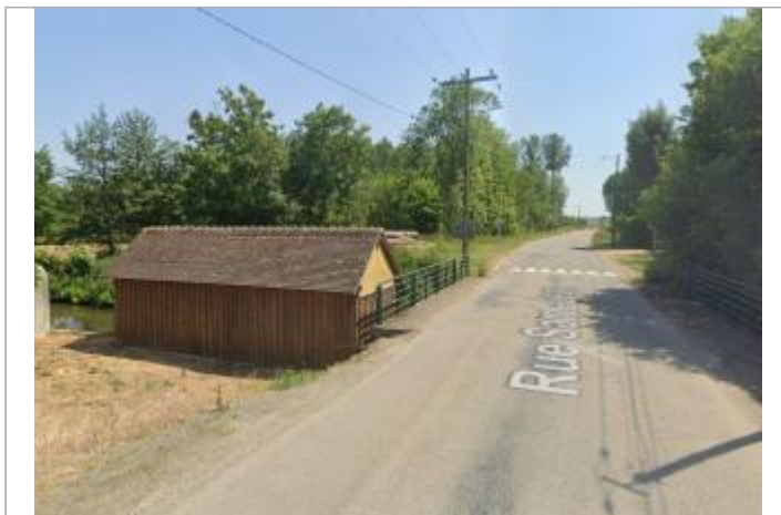
Vue sur le site