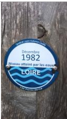
2025_Vue du repère