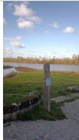
2025_Vue du site