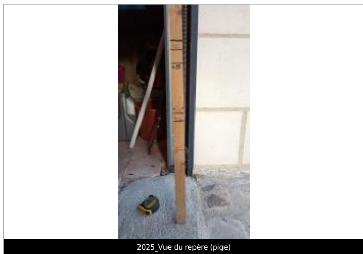
2025_Vue du repère (pige)