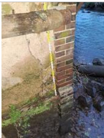
Vue sur la laisse d'inondation