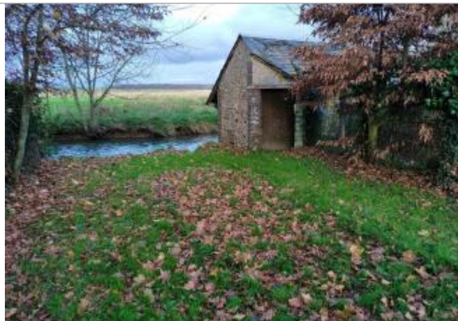
Vue sur le site

Coordonnées WGS84 : X: 1.33394461 / Y: 48.20236870