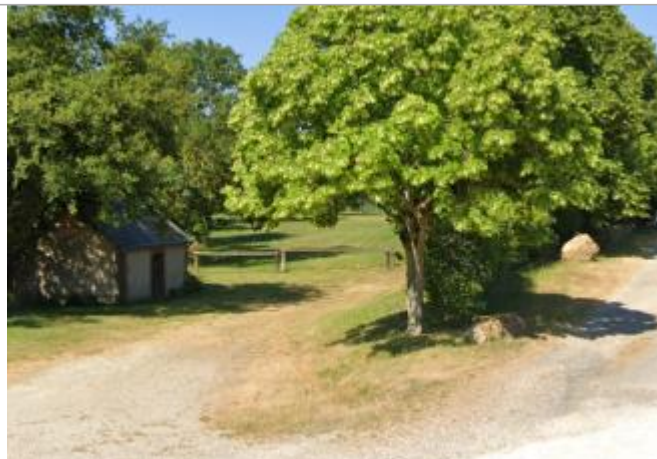
Vue sur le site

Coordonnées WGS84 : X: 1.27820166 / Y: 48.20927170