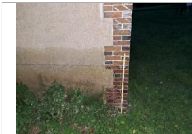
Vue sur la laisse d'inondation