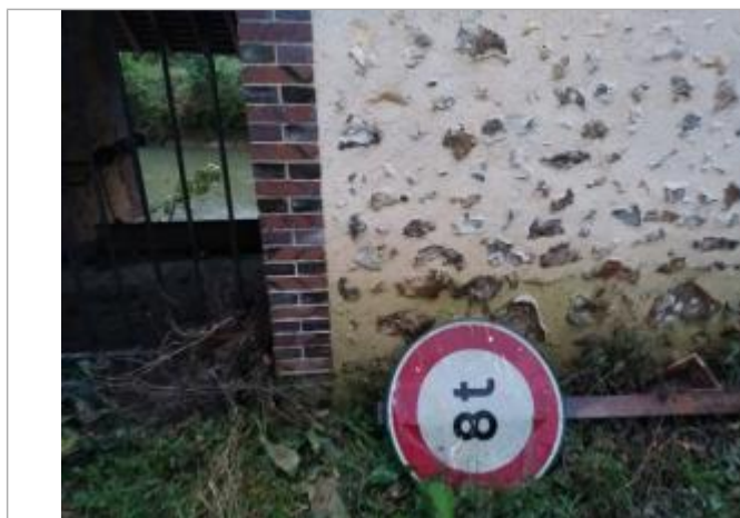
Vue sur la laisse d'inondation