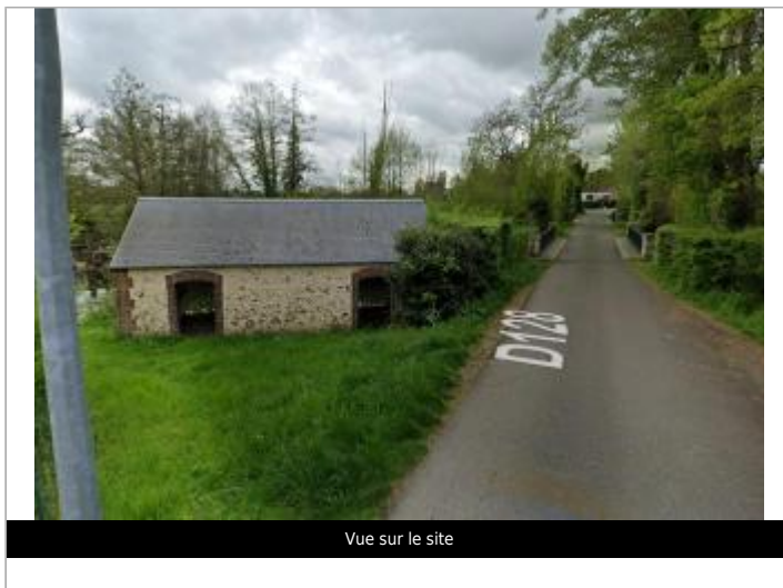
Vue sur le site