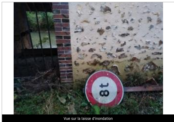
Vue sur la laisse d'inondation