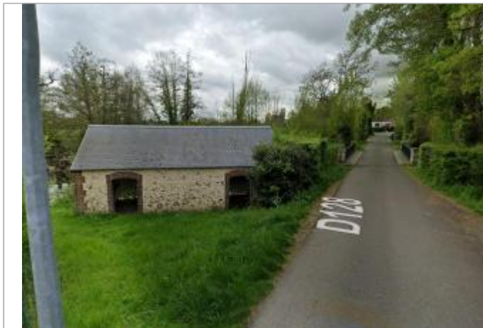
Vue sur le site

Coordonnées WGS84 : X: 1.17210430 / Y: 48.20788690