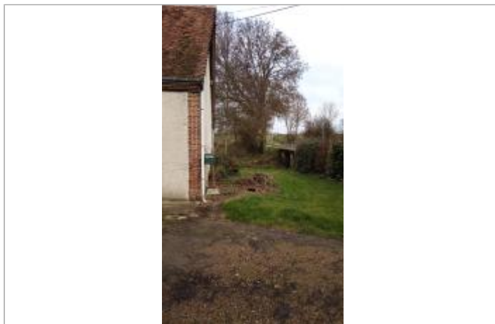
Vue sur le site

Coordonnées WGS84 : X: 1.03906787 / Y: 48.21738700