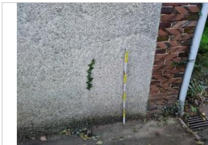
Hauteur mesurée à 50 cm du sol