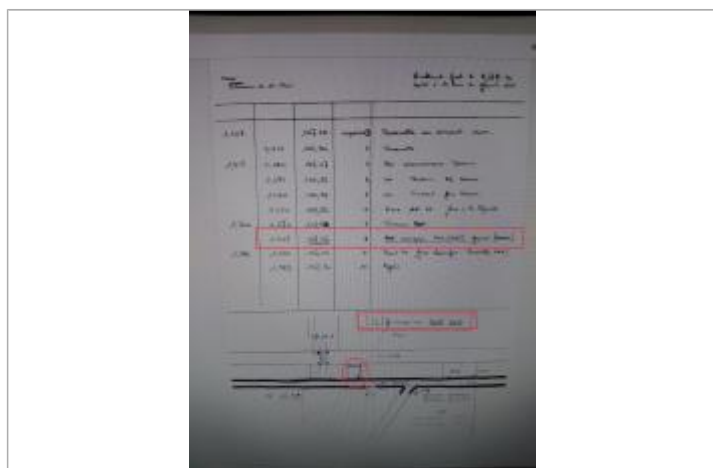
Document de la mairie de Saint Piat.

Altitude calculée de l'eau (en m) : 107.37 m