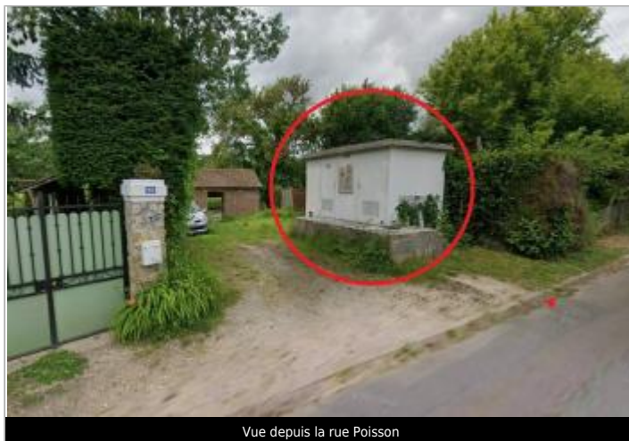
Vue depuis la rue Poisson