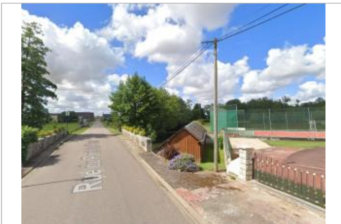
Vue sur le lavoir

GÉOLOCALISATION Coordonnées WGS84 : X: 1.04786132 / Y: 48.14372120 Coordonnées RGF93 (Lambert 93) X: 554819.94 / Y: 6784389.73 Coordonnées RGF93 (ETRS89) : X: 1.0478613 / Y: 48.1437212 Code Hydro: M1114000 Rive de référence: