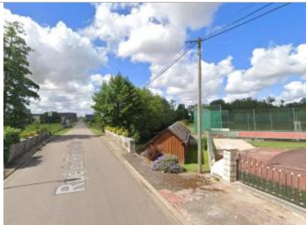
Vue sur le lavoir

Coordonnées WGS84 : X: 1.04786132 / Y: 48.14372120