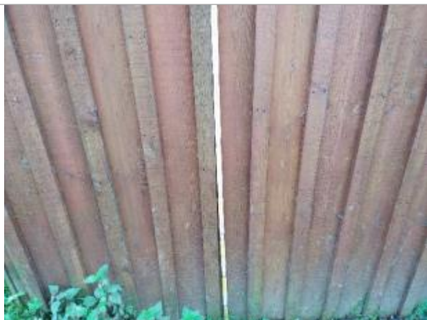
Hauteur mesurée à 81 cm du sol

NIVELLEMENT RÉALISÉ PAR LE SPC MAINE LOIRE AVAL - 16/12/2025