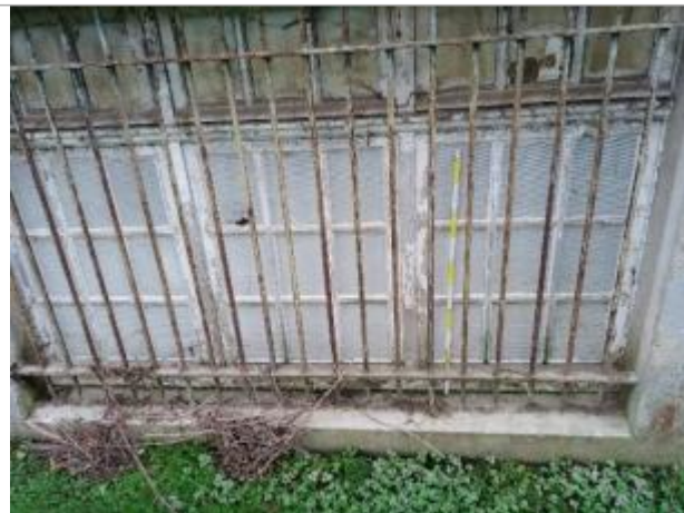
Vue sur la fenêtre

Coordonnées WGS84 : X: 1.05125080 / Y: 48.14298700