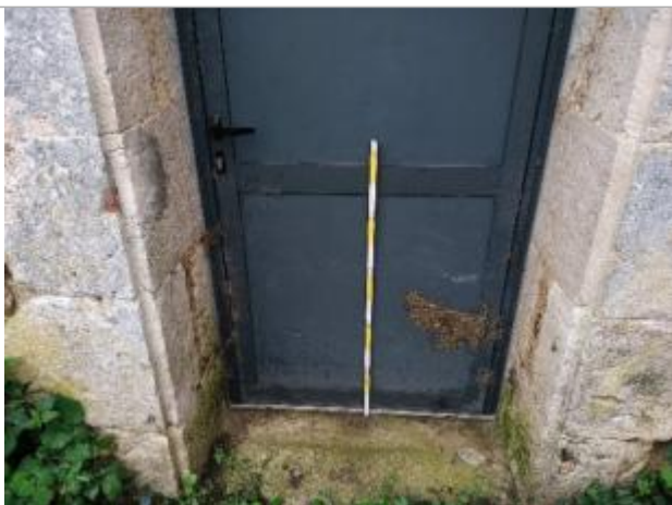
Hauteur mesurée à 62 cm du sol

Altitude calculée de l'eau (en m) : 100.19 m