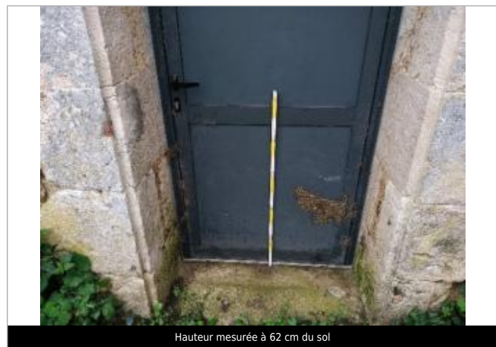
Hauteur mesurée à 62 cm du sol