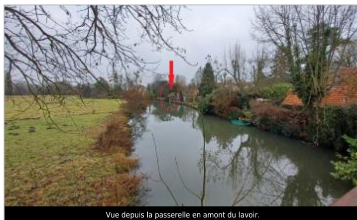
Vue depuis la passerelle en amont du lavoir.

GÉOLOCALISATION Coordonnées WGS84 : X: 1.58427218 / Y: 48.54050330 Coordonnées RGF93 (Lambert 93) X: 595498.26 / Y: 6827633.57 Coordonnées RGF93 (ETRS89) : X: 1.5842722 / Y: 48.5405033 Code Hydro: H4--0200 Rive de référence: Droite