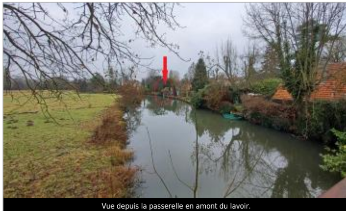
Vue depuis la passerelle en amont du lavoir.