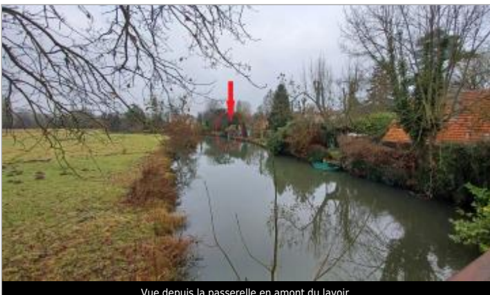
Vue depuis la passerelle en amont du lavoir.

GÉOLOCALISATION Coordonnées WGS84 : X: 1.58427218 / Y: 48.54050330 Coordonnées RGF93 (Lambert 93) X: 595498.26 / Y: 6827633.57 Coordonnées RGF93 (ETRS89) X: 1.5842722 / Y: 48.5405033 Code Hydro: H4--0200 Rive de référence: Droite