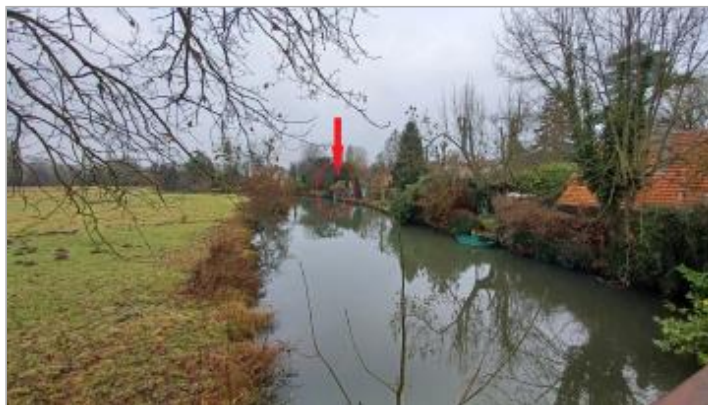
Vue depuis la passerelle en amont du lavoir.

Coordonnées WGS84 : X: 1.58427218 / Y: 48.54050330