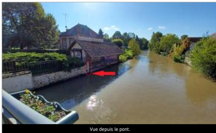
Vue depuis le pont.