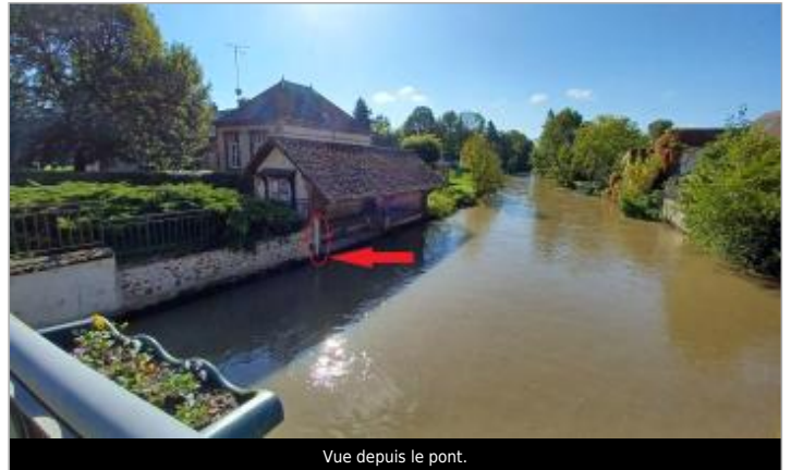
Vue depuis le pont.

Coordonnées WGS84 : X: 1.58435952 / Y: 48.54726850