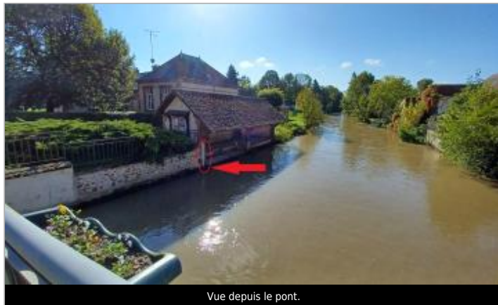
Vue depuis le pont.