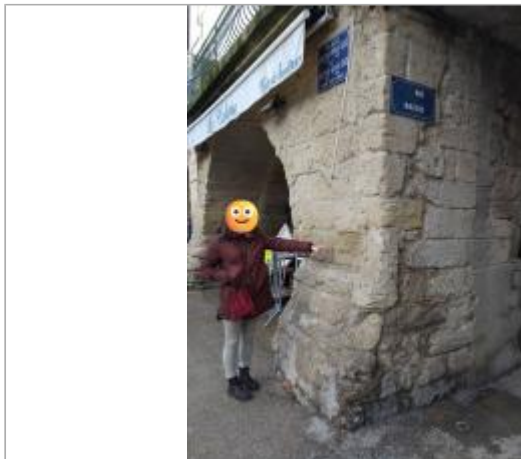
Angle de la place Docteur Dax et Rue Mazelle