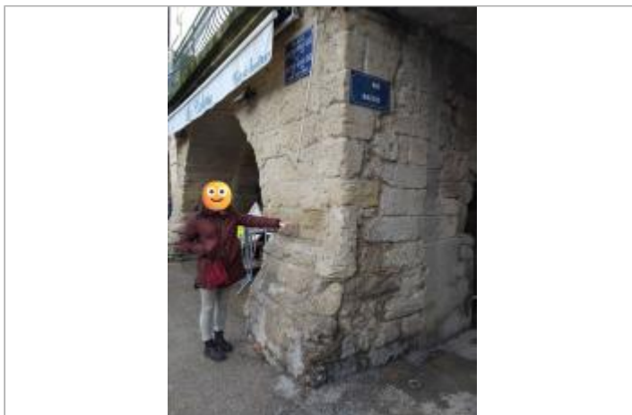
Angle de la place Docteur Dax et Rue Mazelle