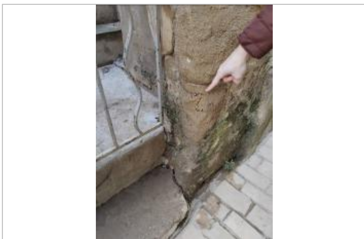
Marque d'inondation sur le mur du n°10 rue Mazelle

Texte : marque mesurée à 0m72 par rapport au sol Visibilité : Non État du repère : Disparu Pérennité : Aucune