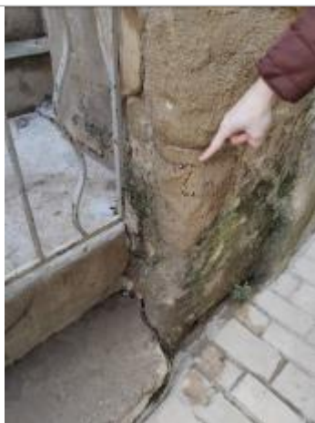
Marque d'inondation sur le mur du n°10 rue Mazelle

Différence entre le niveau d'eau et la référence (en m) : 0.720 m