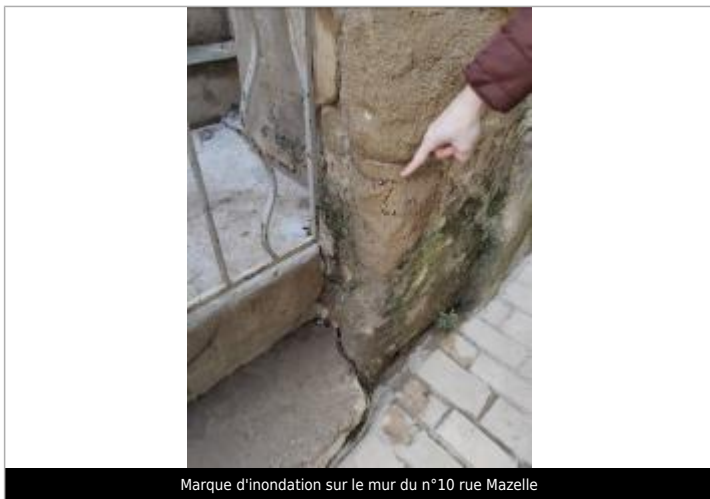
Marque d'inondation sur le mur du n°10 rue Mazelle

Texte : marque mesurée à 0m72 par rapport au sol Visibilité : Non État du repère : Disparu Pérennité : Aucune