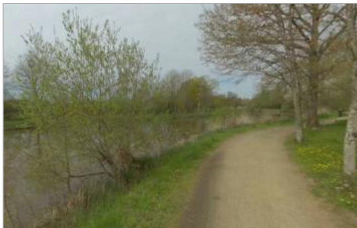
Profil en travers de l'Ille canalisé en amont de Robinson