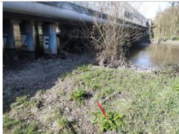
En amont du pont de la rocade Est, rive gauche

Coordonnées WGS84 : X: -1.57799060 / Y: 48.13811800