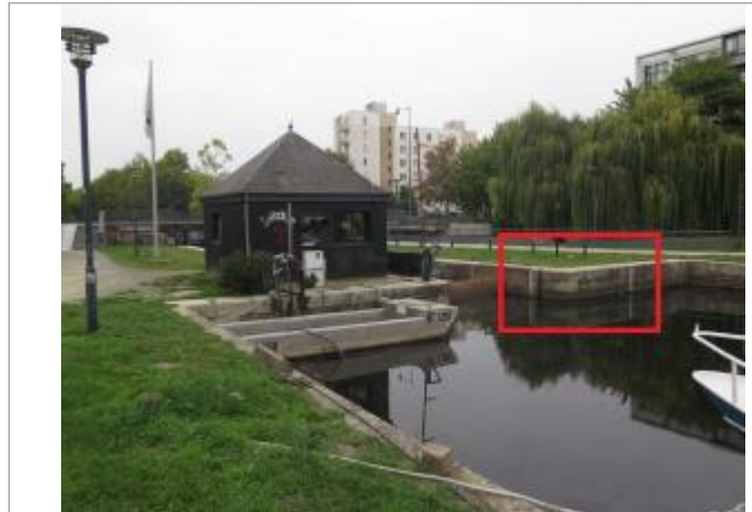
Echelles amont de l'écluse de Saint Martin à Rennes