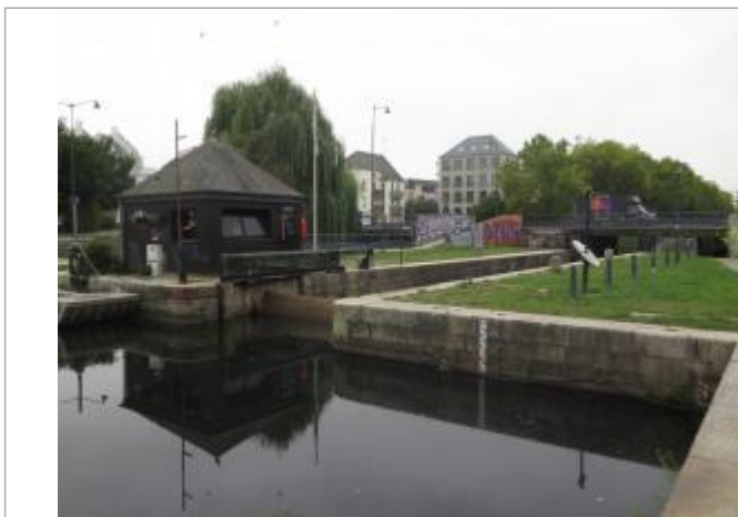
Ecluse St-Martin à Rennes - échelle amont

Altitude calculée de l'eau (en m) : 27.06 m