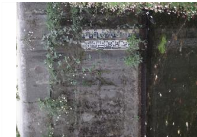
Ecluse du Mail à Rennes - échelle amont

Altitude calculée de l'eau (en m) : 25.29 m