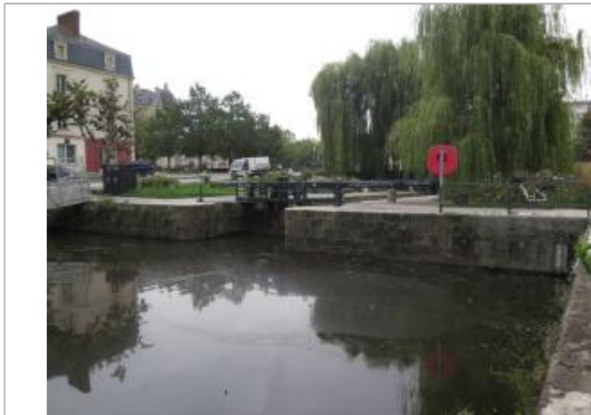
Ecluse du Mail à Rennes - échelle amont