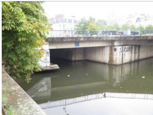
Confluence du canal d'Ille et Rance ( à gauche) et de la Vilaine (à droite)