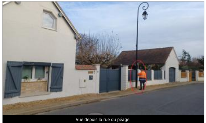
Vue depuis la rue du péage.