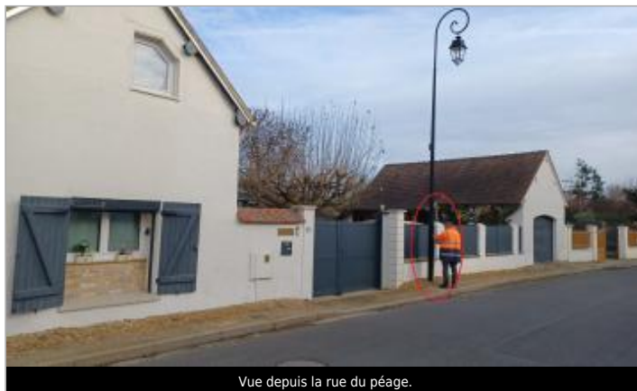
Vue depuis la rue du péage.